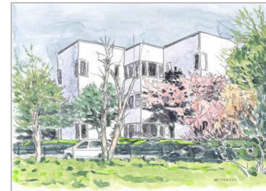
ゆたかな時間を図書館で

登別市立図書館では、「第4次登別市子ども読書活動推進計画」に基づいて お子さまの成長過程に応じたさまざまな読書活動の支援を行っています。