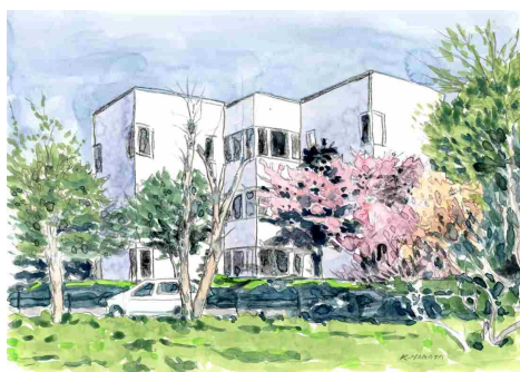
画：長田 清（登別美術協会）