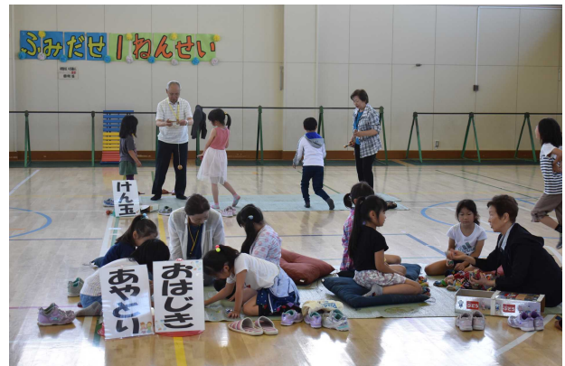
おはじきやお手玉、けん玉で遊ぶ子供たち