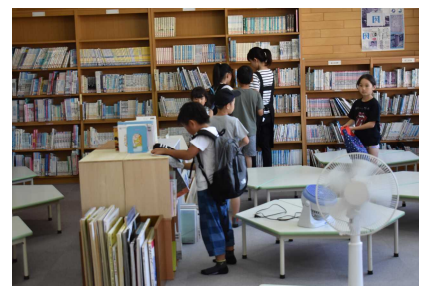
英語の絵本の読み聞かせ(鷲別小)