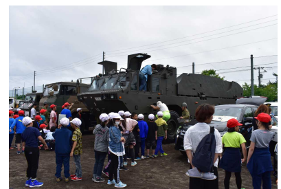
特殊車両に体験乗車する様子