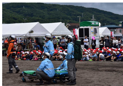
救出訓練の様子を見守る子供たち