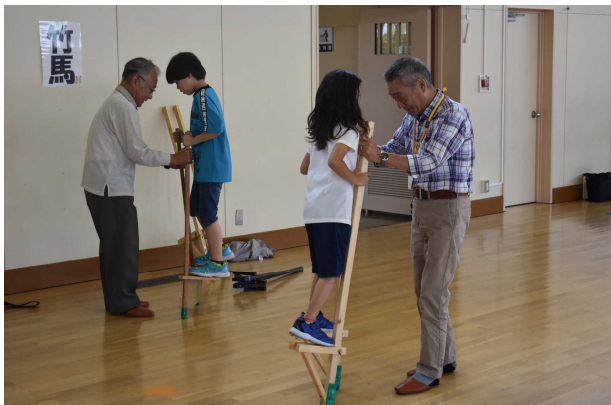
竹馬を教えてもらう子供たち

そのうち、幌別小学校では、7月3日(水)に2年生を対象とした「世代間交流会」が行われ、子供たちは、自分達の地域に住んでおられるおじいちゃんやおばあちゃんたちから、あやとりやお手玉、けん玉、竹馬などの「昔遊び」を教えていただくとともに、一緒に給食を食べて、楽しい一時を過ごしていました。どの子も、笑顔で色々な昔遊びに夢中になって取り組み、とても貴重な体験となりました。