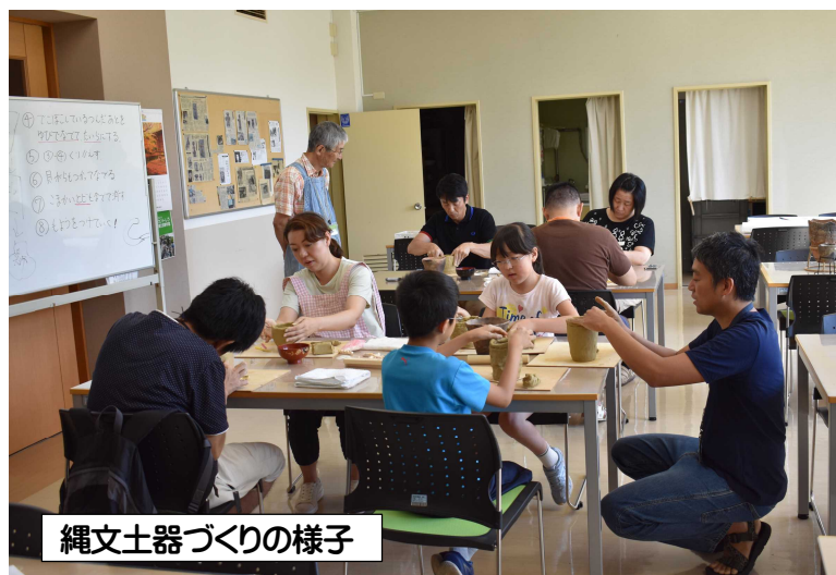
縄文土器づくりの様子