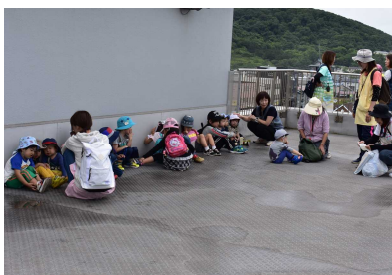
屋上に避難した保育所の子供たち

さらに、非常用発電機や消火器の操作体験、炊き出しカレーや備蓄食糧の試食会など、数多くの「体験ブース」や、陸上自衛隊や警察・消防などの防災機関が、災害時に使用する様々な特殊車両の「展示ブース」が開設され、防災に関する知識や災害時の対応などを体験を通じて学ぶ、大変貴重な機会となりました。