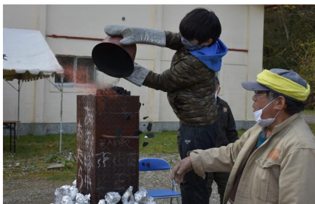
木炭と砂鉄を入れる

11月5日（木）、青葉小学校の5年生（37名）が、日本古来の「たたら製鉄」を伝承するグループ「室蘭・登別たたら会」の皆さんに実演と指導をいただき、たたら製鉄を体験しました。前日、子どもたちがレンガを積んで炉を作り、当日は火入れ後、木炭と砂鉄（イタンキ浜とアヨロ海岸で採取）の重さを量り、炉に入れる作業を交替で26も行いました。途中、1400度に達した炉の中を連結させた管から覗いて観察し、火入れから7時間後に炉を解体し「鋳（けら）」と呼ばれる鉄の塊（約5.2kg）を取り出すことに成功しました。子どもたちにとっては、大変貴重な「ものづくり」の体験となり、生涯忘れられない体験となりました。