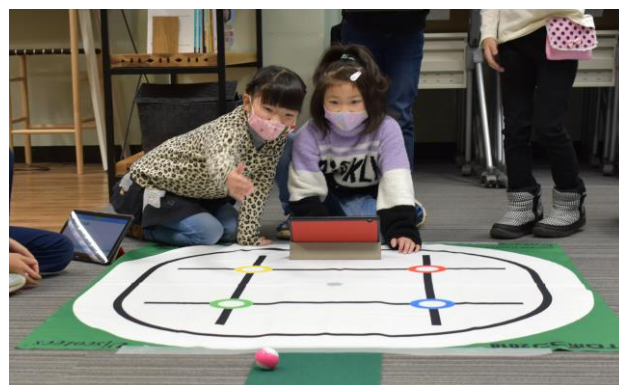
的に向かってチャレンジ