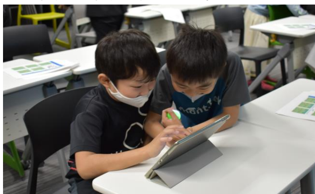
プログラムを二人で調節

幌別小学校の3年生～6年生が、日本工学院北海道専門学校でプログラミング学習の授業を受講しました。11月13日（金）は3年生、20日（金）は4年生、12月8日（火）は5年生、15日（火）は6年生の授業が実施されました。3年生は、スフィロというボール型のロボットを使用して、視覚的にプログラミングを学びました。スフィロに、動かす時間や方向、早さをプログラミングし、的に合わせてそれを動かします。的に外したらプログラミングを何度も組み直します。その結果、後半には的に入った班もいくつかあり、盛り上がりました。6年生は、コースが難しく、プログラミングを組むことも難しい中、何回もチャレンジしていました。どの学年の子どもたちも、熱心に講師の話聞いて楽しく積極的に取り組んでいた姿は大変立派でした。