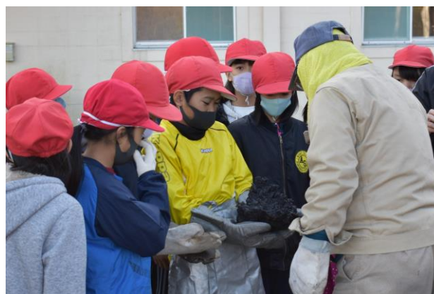
鋳の重さは何キロか