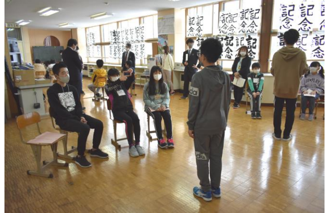
グループで「将来の夢を紹介」