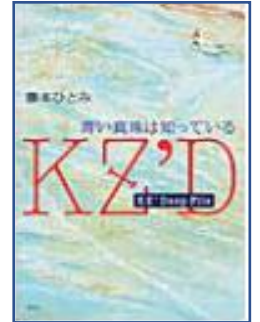
★KZ' Deep File 青い真珠は知っている★ (藤本ひとみ:著 講談社)