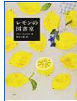
☆レモンの図書室☆ (ジョー・コットリル:作 杉田七重:訳 小学館)