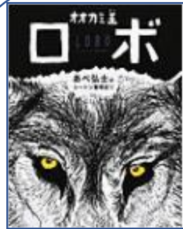
☆オオカミ王ロボ☆ あべ弘士のシートン動物記①☆ (アーネスト・シートン:原作 あべ弘士:文・絵 学研プラス)