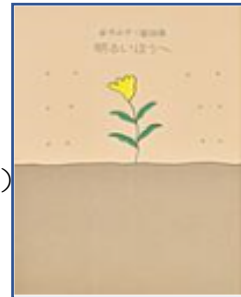
☆金子みすゞ童謡集 明るいほうへ☆ (金子みすゞ:著 矢崎節夫:選 JULA出版局)