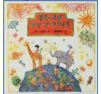
★ちきゅうは メリーゴーラウンド★ (まどみちお:詩 みなみづかなお:え 南塚直子:絵 小峰書店)