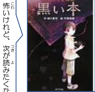
☆ついてくる怪談 黒い本☆ (緑川聖司:作 竹岡美穂:絵 ポプラ社)