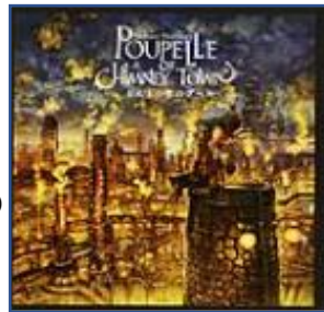
★えんとつ町のプペル★ (にしのみあきひろ:作 幻冬舎)