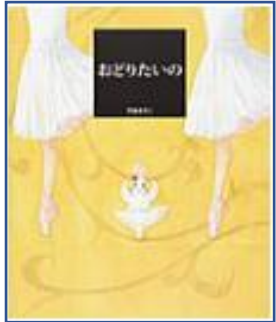
☆おどりたいの☆ (豊福まきこ:作 ビーエルしゅつぱん)