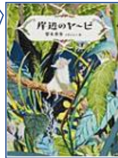
★岸辺のヤービ★ (梨木香歩:著 小沢さかえ:画 福音館書店)