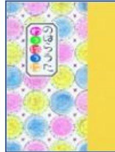
☆のはらうた わはっは☆ (工藤直子:作 童話屋)