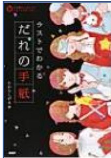
★ラストでわかる だれの手紙★ (たからしげる:編 ビーエイチペーパーリサーチ)