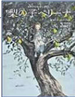
☆梨の子ペリーナ☆ (イタロ・カルヴィーノ:再話 関口英子:訳 酒井駒子:絵 BL出版)