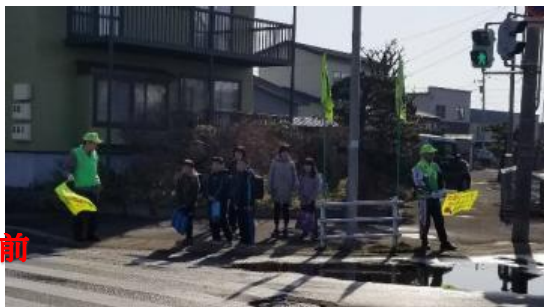
旧明德珠算塾前 (常盤通)