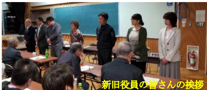
新旧役員の方々の挨拶

5月8日に、西陵中学校で青少協の総会が行われました。前半は室蘭警察署の警察官より、「室蘭地区の少年犯罪等の実態と少年の薬物対策について」の講話があり、後半の総会では、活動計画や予算、新役員が承認されました。また、総会の中で出席された方から、「9月の連合町内会の避難訓練は、家にいるときの子どもを守るためにとっても大切だから、ぜひ多くの子どもにも参加してほしい。更に参加の働きかけをお願いしたい」との要望が出されました。