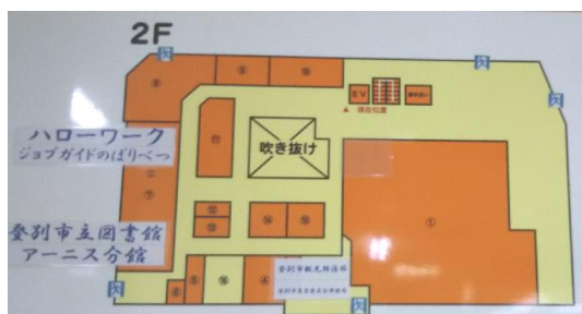
アーニス 2階見取り図