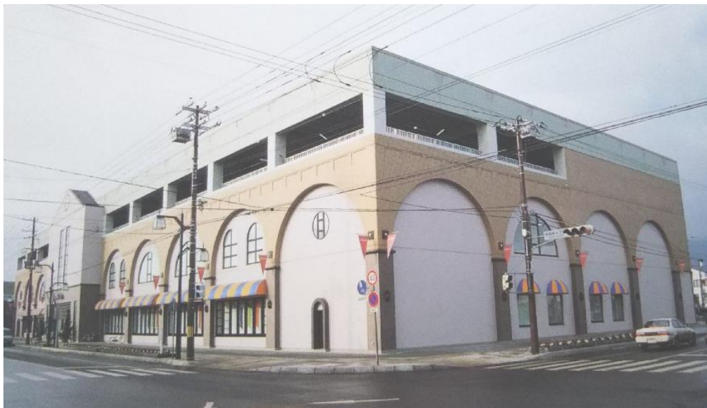
アーニスショッピングセンター