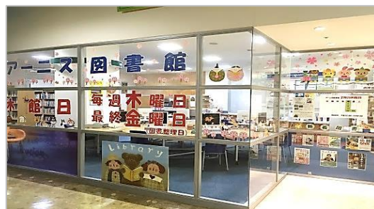
アーニス分館 入り口