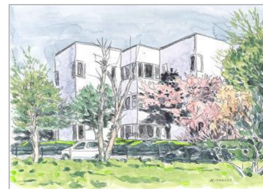
ゆたかな時間を図書館で

登別市立図書館では、「第3次登別市子ども読書活動推進計画」に基づいて お子さまの成長過程に応じたさまざまな読書活動の支援を行っています。