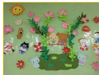
山本さん作成 児童室壁面装飾

活動の中で図書館職員さんを含め色々な年齢層の人と接する機会もあり、人とのつながりを作るきっかけにもなります。