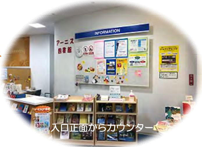
入口正面からカウンター