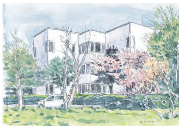
豊かな時間を図書館で