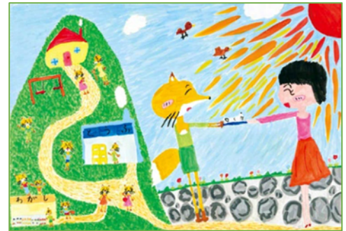
【受賞作：キツネのとうふ】

「とうふやのかんこちゃん」を読んで、お父さんに豆腐の作り方を教えてくれたきつねに、かんこちゃんがお礼をあげている場面が頭に浮かんできたので、その場面を描きました。絵に描きたい場面が浮かんでこない時には、何十冊も本を読んで決めることもあります。