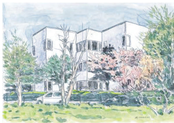
画：長田 清（登別美術協会）