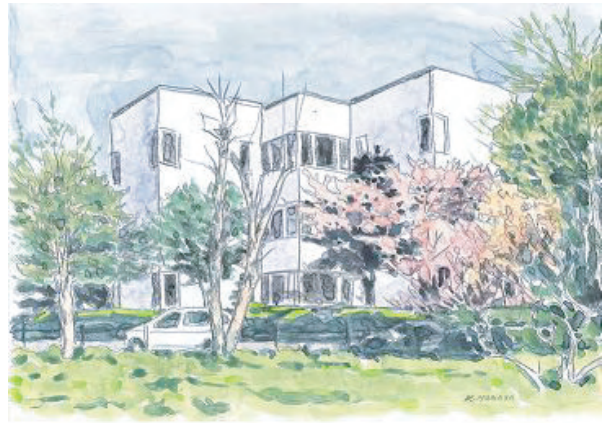
画：長田 清（登別美術協会）