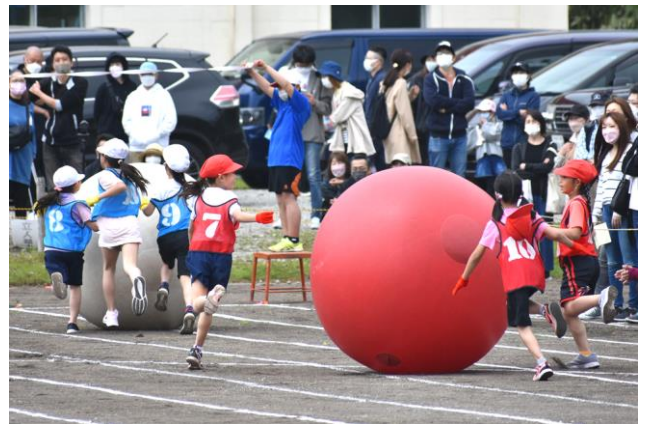
2年生大玉ころがし