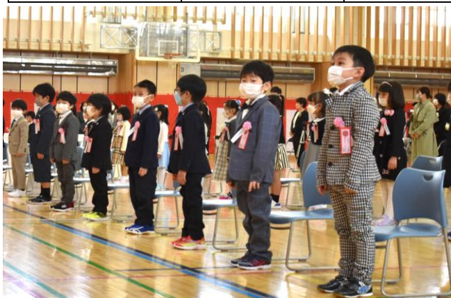
鷺別小学校の入学式