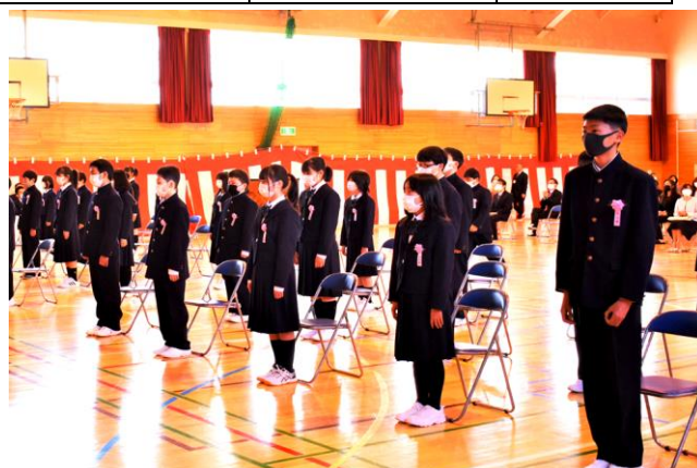
西陵中学校の入学式