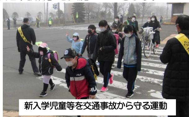
新入学児童等を交通事故から守る運動

街頭指導、巡回指導などに取り組み、子どもの非行防止と登下校の安全確保に努めます。また、不審者情報を地域と共有し、監視と巡回パトロールを実施するほか、子どもが不審者と遭遇した場合に備える「駆け込み訓練」を実施していきます。