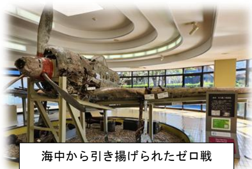
海中から引き揚げられたゼロ戦