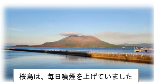
桜島は、毎日噴煙を上げていました

最も若くして戦死したのは、17歳の少年飛行兵。今で言うと高校2年生です。そんな若者たちが戦況の悪化を憂い、国を守るために命を賭して敵艦に体当たりするのです。絶対にあってはならない無謀な作戦が、国策として進められてしまったことに憤りを感じてなりません（館内で上映されていたDVDも一貫して特攻作戦を否定しています）。