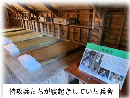
特攻兵たちが寝起きしていた兵舎

ただ、大勢の若者たちが亡くなったのは事実です。彼らの死を決して無駄にしないよう、今を生きる私たちは戦争のない平和な世の中を「当たり前」と思わず平和を守り続ける努力をしなければなりません。それでは、自分に何ができるのか。社会科教師として、校長としてできることは何か…。自問自答の末に行き着いた結論は、子供たちが「自ら考え、自ら判断し、自ら行動できる」自立した大人になる手助けをすること。