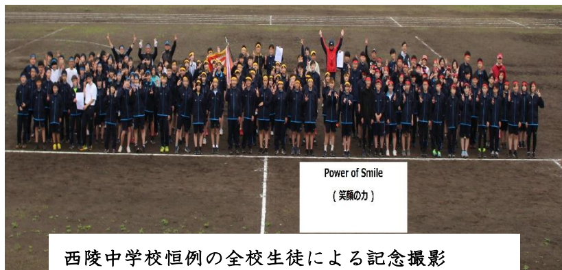
西陵中学校恒例の全校生徒による記念撮影

平日にもかかわらず、70名以上の保護者の皆様のご参観と温かい励ましの応援を沢山頂きました。2学期は、本校の教育活動を公開予定です。ぜひご来校ください。