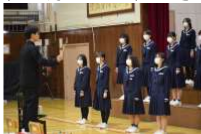
発行責任者：校長 鈴木 恭 朗