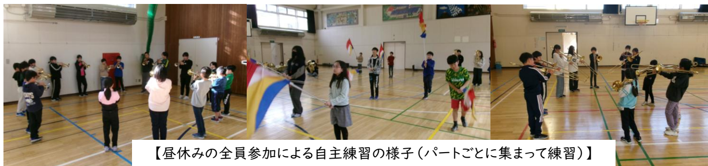
【昼休みの全員参加による自主練習の様子(パートごとに集まって練習)】

これからも子どもたち一人一人の成長を通して集団としての力を高めていきたいと思いますので、ご家庭におかれましても、お子さんへの励ましなどの声掛けをお願いします。