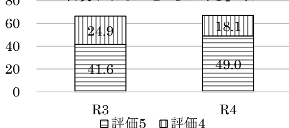
「自分にはよいところがある」%