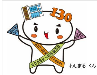
新校舎落成・開校130周年記念 キャラクター「わしまるくん」