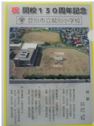
記念クリアフォルダ