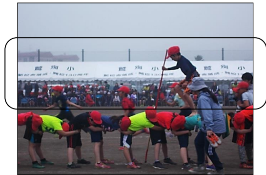
運動会用テント3張