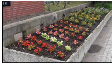
学校花壇用花各種