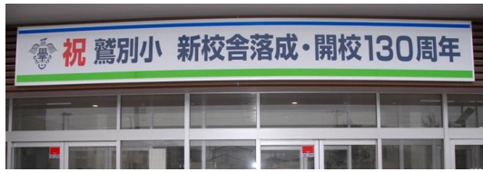
新校舎落成・開校130周年記念看板