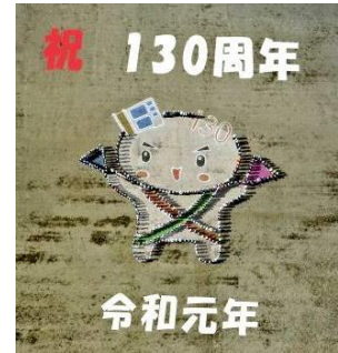
記念全校写真・航空写真