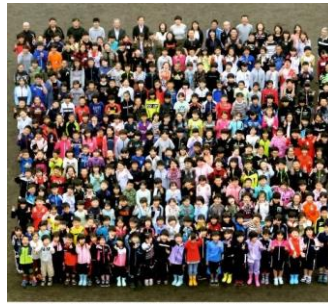
祝 130周年記念 登別市立鷺別小学校 令和元年